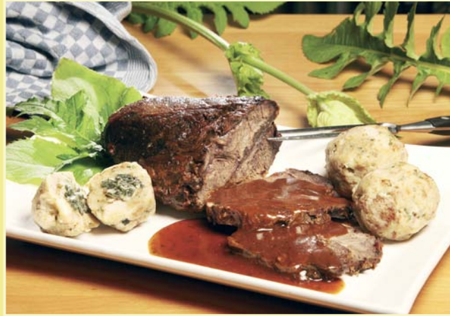
Spätsommer im „Jean Bonnet“: Gallowayschulter mit einer Dost-Schafgarbe-Sauce, an Semmelknödeln mit Kohldistelfüllung

einem Kochkurs teilnehmen und sich zur Wildkräuter-Werkstatt anmelden.