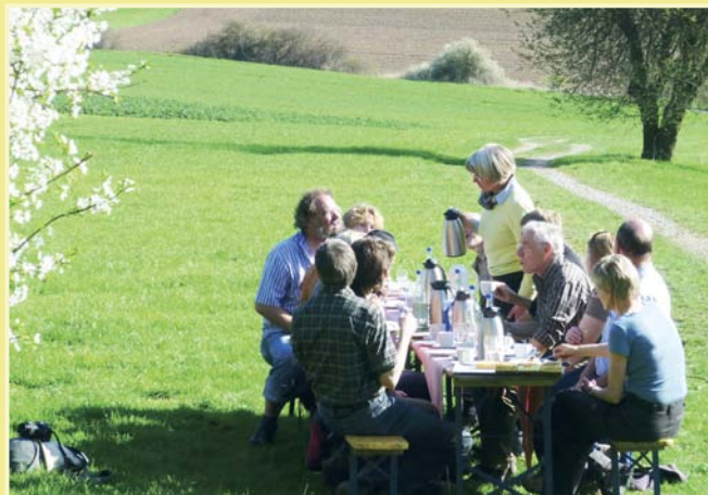
Picknick mit Blick ins Diemeltal – ein Erlebnis, das wir auch für Sie gerne arrangieren.

Gruppen bieten wir neben den klassischen Obstkuchen mit Kaffee, ganz spezielle und erlebnisreiche Angebote, wie Kräuterwanderung mit Picknick, Wurst- oder Käse-Degustation sowie Wildkräuter-Imbiss mit kurzweiligem Vortrag. Planen Sie uns ein.