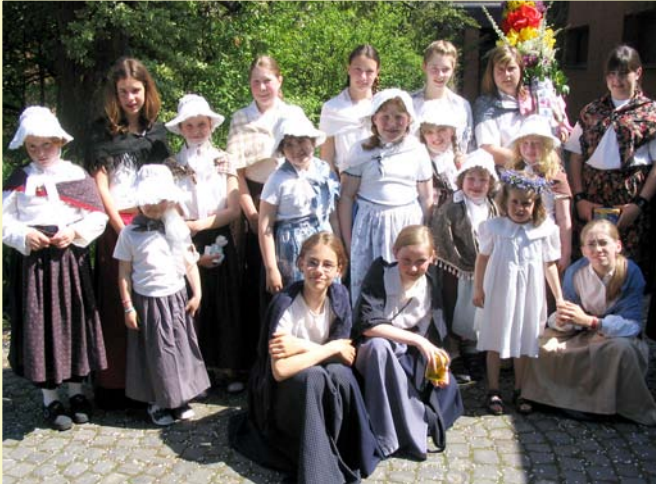
Traditionelles Mayence-Fest in Kelze

Mitten in Deutschland, in Hessens Nordspitze und abseits großer Straßen, finden Sie unser Landgasthaus im kleinen Hugenottendorf Kelze, wo alte Traditionen gelebt werden.