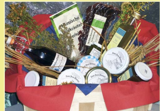
Als Souvenir oder Geschenk bieten wir Produkte aus Wildkräutern und Gutscheine

bei Kerzenschein und frischen Blumen mit Übernachtung und Sekt-Frühstück. Oder bleiben Sie mehrere Tage und erwandern Sie unsere Region. Wir beraten Sie gerne.